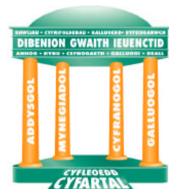
Datganiad y Cwricwllwm Gwaith Ieuenctid ar Gyfer Cymru